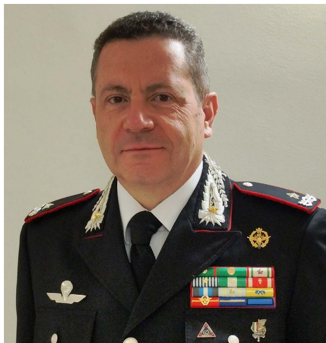
Generale di Brigata Raffaele Covetti, Comandante dei NAS dell'Arma dei Carabinieri

Generale Covetti, tra le varie funzioni di tutela della salute pubblica i NAS possono essere visti anche come