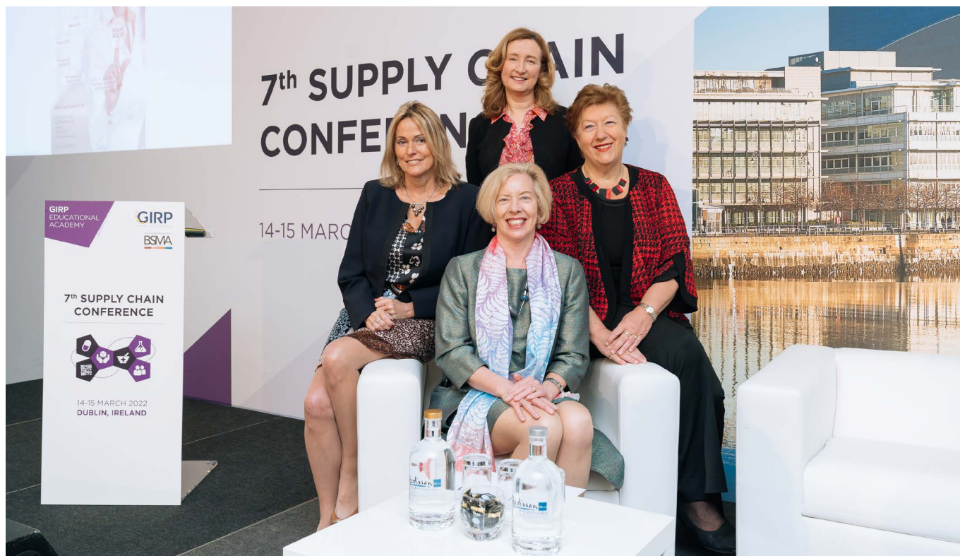
Nella foto: Monika Derecque-Pois , direttore generale, GIRP (a sinistra); Emer Cooke , direttore esecutivo dell'Agenzia europea per i medicinali (al centro); Christa Wirthumer-Hoche , capo dell'Agenzia austriaca per la salute e la sicurezza alimentare (Ages) (a destra); Lorraine Nolan , amministratore delegato dell'Autorità di regolamentazione dei prodotti sanitari (Hpra) e presidente del comitato di gestione dell'EMA (in alto)

Nel sottolineare l'esito positivo di una storia che ha quasi dell'incredibile, Catherine Cummins ha ripercorso i giorni precedenti alla distribuzione dei vaccini e ha ricordato le sfide affrontate dai